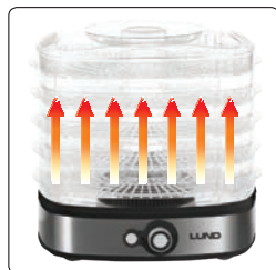
Zirkulationssystem der heißen Luft